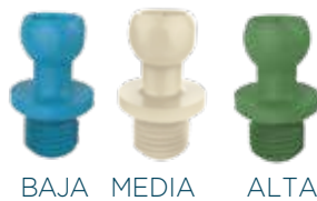
BAJA MEDIA ALTA

Fabricadas a base de PEEK (PolieterEterCetona); plástico de elevadas prestaciones, con elevada resistencia a los productos químicos agresivos, excelente resistencia mecánica y estabilidad dimensional. El PEEK es resistente a la hidrólisis, al vapor y al agua. Los Elementos Retentivos deben ser manipuladas cuidadosamente para evitar daños. Cuando se posiciona la prótesis por encima de los Abutments antes de asentarla, tener cuidado en evitar que los Elementos Retentivos se deslicen por encima de los topes del Abutment, lo que puede causar su rotura.