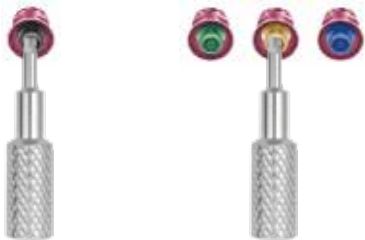
Inserción de la retención con los dedos en el Abutment/Análogo.